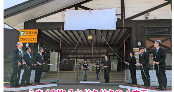
うまく割れるかドキドキのくす玉

快晴の中、今年度の広報館開館に合わせ、愛称・シンボルマークの看板除幕式が盛大に執り行われました。