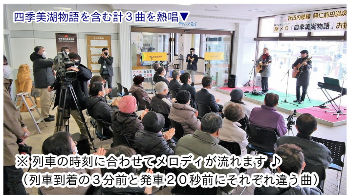
四季美湖物語を含む計3曲を熱唱▼

※列車の時刻に合わせてメロディが流れます♪ (列車到着の3分前と発車20秒前にそれぞれ違う曲)