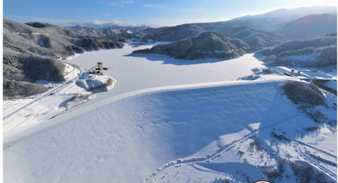
▼1月21日 ドローンによる空撮

1週間に1度晴れるか晴れないか、 という冬の気まぐれな天気ですが 晴天の凜とした空気の中に浮かび上 がる森吉山ダムの姿は圧巻です！