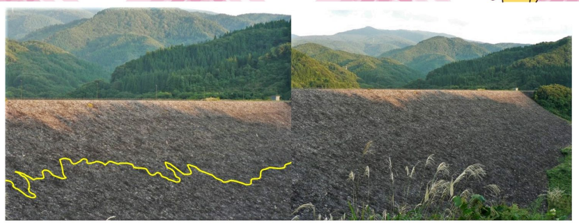
最初は中ほどにあった影が(黄色線) どんどん堤頂に迫って消えました

9月に入ってから日の短さを感じるようになりました。退庁時に夕陽がきれいだったのでたまたま振りかえったところ、山の影が堤体に映っているのに気がつきました。わずか10分位の短い時間でしたが、大きいスクリーンに映った影絵はちょっと厳かな感じがしました。支所にカメラを取りに戻ったら、一番良いところを逃してしまいました～(T_T)