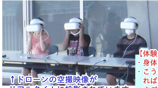
↑ドローンの空撮映像がリアルタイムに投影されています