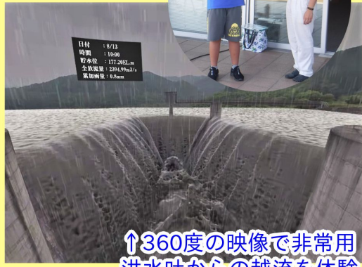
↑360度の映像で非常用洪水吐からの越流を体験