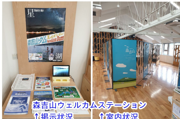
森吉山ウェルカムステーション ↑掲示状況 ↑室内状況

新ポスターは秋田内陸線・阿仁合駅2階の「森吉山ウェルカムステーション」のほか、ダム広報館や北秋田市内の観光施設に掲示さ