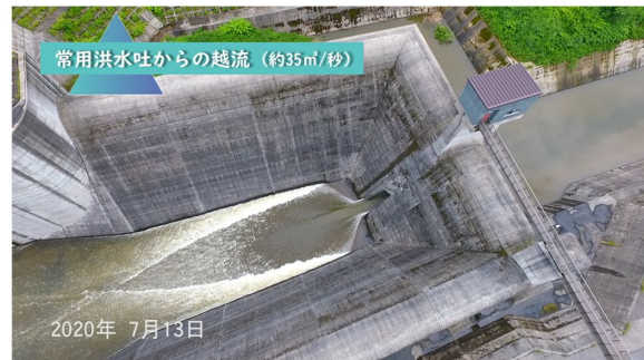
常用洪水吐からの越流 (約35m³/秒)

(紙面中段右の記事から) 前線性降雨に伴う流入量増加でダムの洪水吐から越流がありました。この時の映像は能代河川国道事務所 公式Twitter・公式Facebookに掲載しています。ぜひ、ご覧ください！