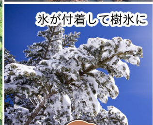
氷が付着して樹氷に