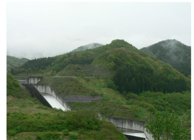
雨のダムも風情があります

5月も半ばが過ぎ、ダム周辺もようやく春らしくなってきました。植物が一斉に芽吹くため、山全体が大きく、「もふもふ」と丸みがかつたようになります。異なる色彩がパッチワークのようで賑やかです。洪水吐きからの越流も毎日みる事が出来ます。支所にいたる坂の駐車場は、おすすめのビューポイントです。流れ落ちる水音が迎りに響き渡り、今しか見ることが出来ない壮大で爽やかな眺めに魅入ってしまいました。