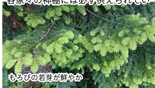
もろびの若芽が鮮やか