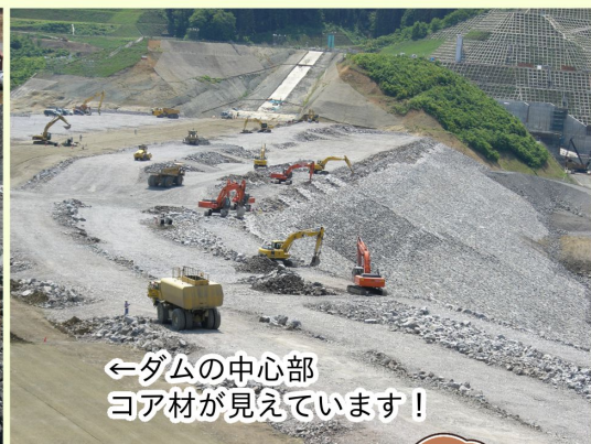
←ダムの中心部 コア材が見えています!