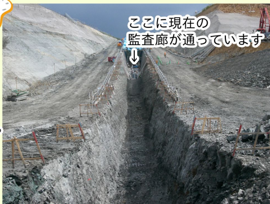
ここに現在の監査廊が通っています

来年度に森吉山ダムは完成後10周年を迎えます。そこで今回は懐かしのダム建設中の写真をご紹介します。左は2003年に撮影された監査廊の掘削工事。写真右は2006年の堤体盛立て工事の様子です。多くの方のご尽力と想いが詰まったダムであることを改めて実感します。