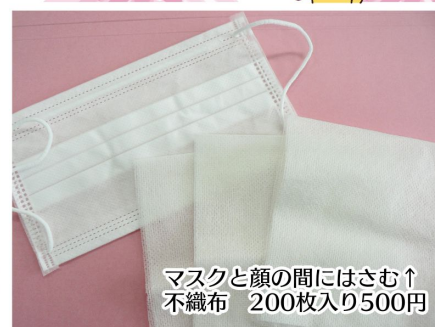
マスクと顔の間にはさむ↑ 不織布 200枚入り500円