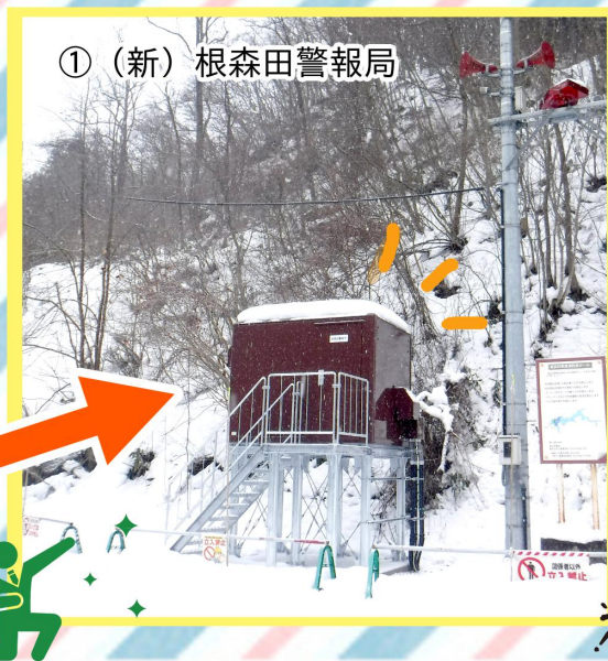
① (新) 根森田警報局