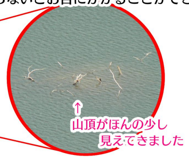
↑山頂がほんの少し見えてきました

この先「ちゆき山」が顔をすっかり見せるか。ぜひ、ダムにいらして確認してみてください。 ※移転された方々が信仰されていた山