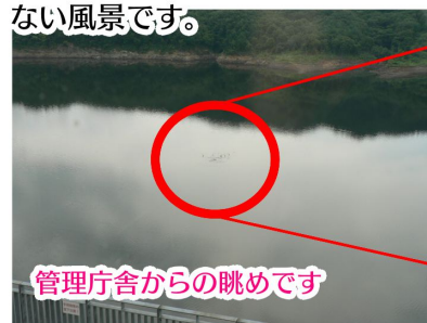
管理庁舎からの眺めです

※ダム湖の水位が低くなると見える山「ちゆき山」。今年はこれまでまとまった雨もなくお盆を過ぎた頃から、山頂の枯れ木が少し見えるようになりました。例年2~3月にならないとお目にかかることができない風景です。