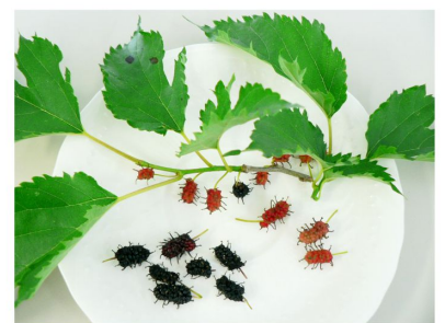
黒い方が熟した実です

早速食してみました。かなり小粒ですが、ギュッと濃縮されたワイルドな甘さでした。(はじめての食レポでしたが伝わったでしょうか^^)