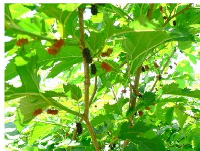
アンチエイジングに効果的♪ (らしい)

ダム管理支所のちかくで、すずなりに実をつけた桑の木を見つけました。この桑の実、巷ではマルベリーとよばれ（西洋種）、健康にも美容にも良いスーパーフードとして注目されているそうです。