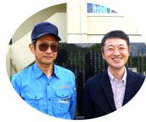
←遊覧船の船長と記念に「カシャ!」

6月1日（土）森吉ダム・太平湖グリーンハウスでは湖水開きが行われ、1日から運行を開始した遊覧船の無事故、奥森吉に観光で訪れる方々の安心安全を祈願する安全祈願式が行われました。遊覧船が昭和45年に初就航、遊歩道などが整備されてから約50年が経過し、これまでに訪れた方は約28万人となったそうです。