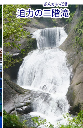
さんかいだき 迫力の三階滝

6月1日（土）森吉ダム・太平湖グリーンハウスでは湖水開きが行われ、1日から運行を開始した遊覧船の無事故、奥森吉に観光で訪れる方々の安心安全を祈願する安全祈願式が行われました。遊覧船が昭和45年に初就航、遊歩道などが整備されてから約50年が経過し、これまでに訪れた方は約28万人となったそうです。