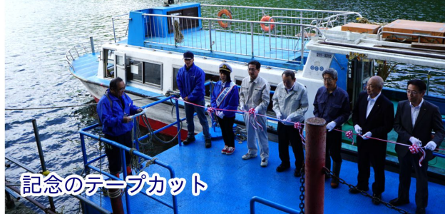
記念のテープカット