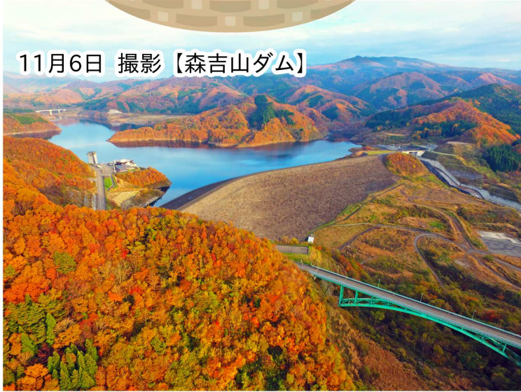
11月6日 撮影【森吉山ダム】

発行者：国土交通省 東北地方整備局 能代河川国道事務所 森吉山ダム管理支所 秋田県北秋田市根森田字姫ヶ岱31 TEL：0186-60-7231 FAX：0186-60-7232 http://www.thr.mlit.go.jp/noshiro/kasen/moriyoshi/