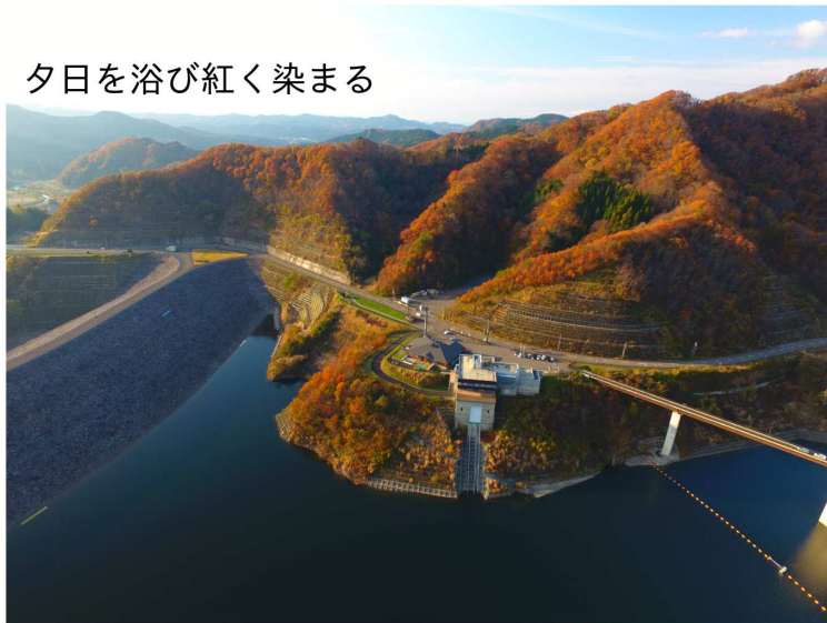
夕日を浴び紅く染まる