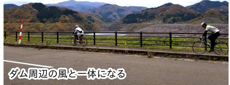
ダム周辺の風と一体になる

自転車好きの方、来シーズン、サイクリングに来てみて下さい！そして喜んでもらえれば幸いです！