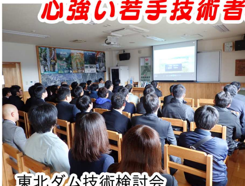
東北ダム技術検討会