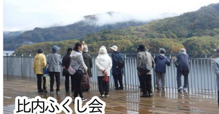
比内ふくし会 ふれあいサロンかたりあい