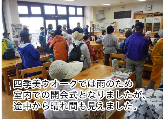
四季美ウオークでは雨のため室内での開会式となりましたが、途中から晴れ間も見えました。

10月9日(火)北秋田市医療健康課主催の「四季美ウオーク」と10月13日(土)秋田内陸線主催の「スマイルウオーク2018」が開催。色付いた山々を眺めながら、気持ち良い汗を流しました。