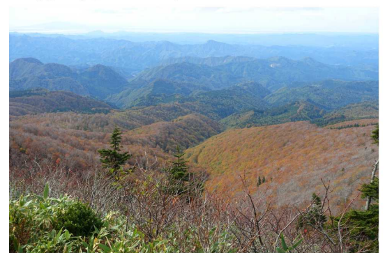
10月15日 撮影【阿仁スキー場】 撮影場所：ゴンドラ山頂駅舎から