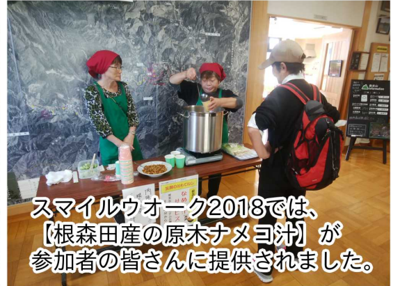
スマイルウオーク2018では、【根森産の原木ナメヨ汁】が参加者の皆さんに提供されました。