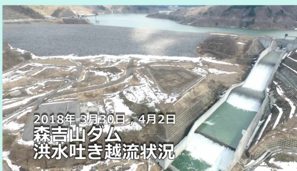
2018年3月30日、4月2日 森吉山ダム 洪水吐き越流状況