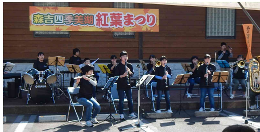
森吉中学校 吹奏楽部の楽しい演奏