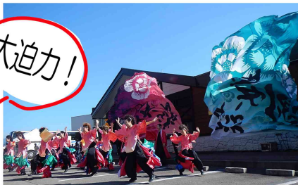
大館よさこい祭姫會の演舞