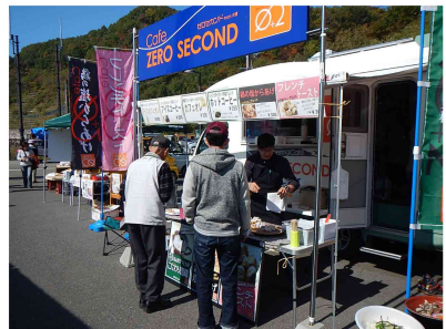
県北の美味しいものがずらり