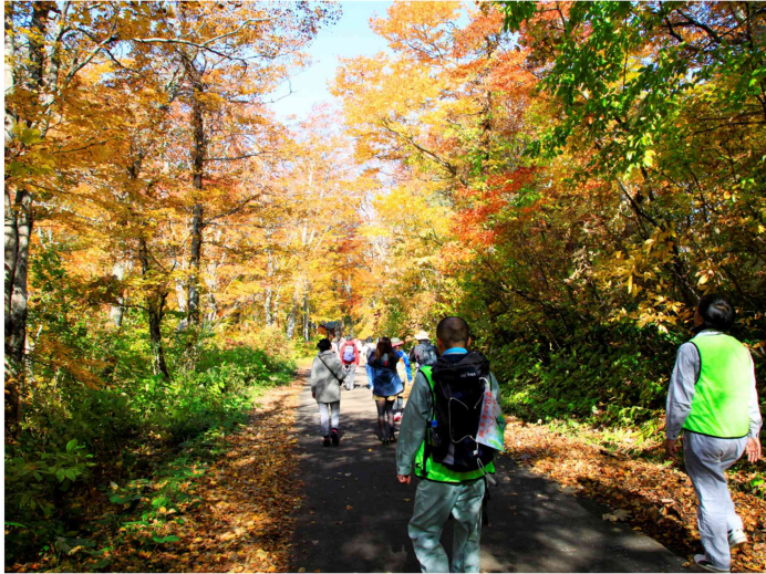
晴天に恵まれた 紅葉ウォーキング

10月18日（日）森吉山ダム水源地域ビジョン実行委員会主催による四季美湖紅葉まつりが開催されました。晴天にも恵まれ過去最大の約1200名の参加となりました。