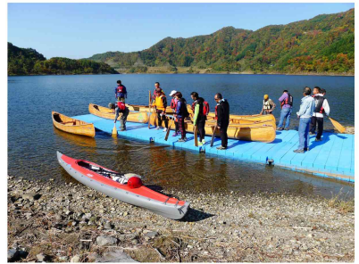
大人気！絶景のカヌー体験