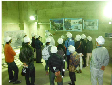
満員御礼のダム探検隊

10月18日（日）森吉山ダム水源地域ビジョン実行委員会主催による四季美湖紅葉まつりが開催されました。晴天にも恵まれ過去最大の約1200名の参加となりました。