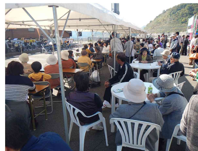
過去最高の来場者数に