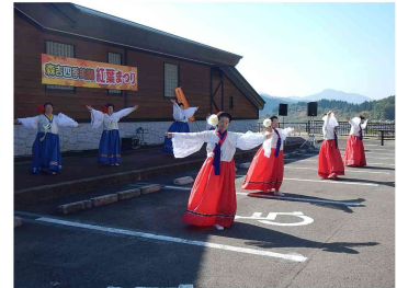
初出演の七座ぜんまい座