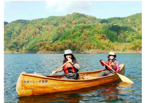
秋田杉のカヌーで湖面散策