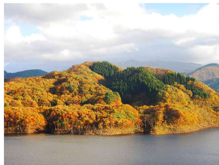
紅葉最盛期の森吉四季美湖