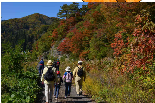
紅葉ウォーキング参加者募集中！

※当日は秋田内陸線 阿仁前田駅から発着時間に合わせて無料シャトルバスを運行しますので、是非 秋田内陸線を利用してお越しください。