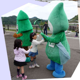
森っち・スグッチと握手