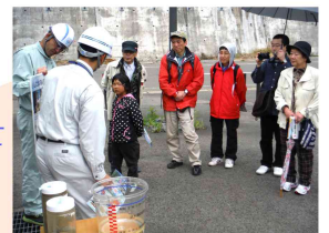
ダム探検隊 模型を使って 説明中・・・