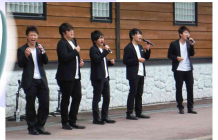
秋田大学アカペラサークルixi 美声が山々に響き渡りました