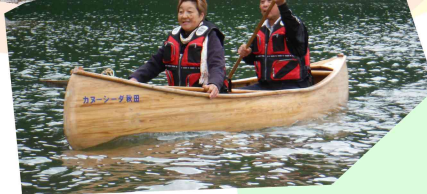
秋田杉のカヌーで湖面を散策しました