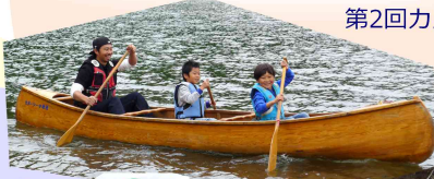
第2回カヌーマラソン大会！ 力を合わせてエイエイオー！