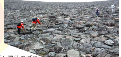
ダム堤体のぼり 迫力があります！