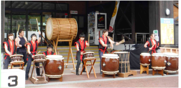
ステージイベントでは、前田三味線倶楽部や 森吉山麓火祭り太鼓らによる圧巻のパフォーマンス