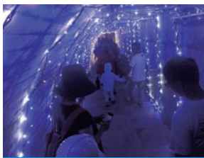
広報館前に集合し、監査廊見学をする約1時間のコースです。