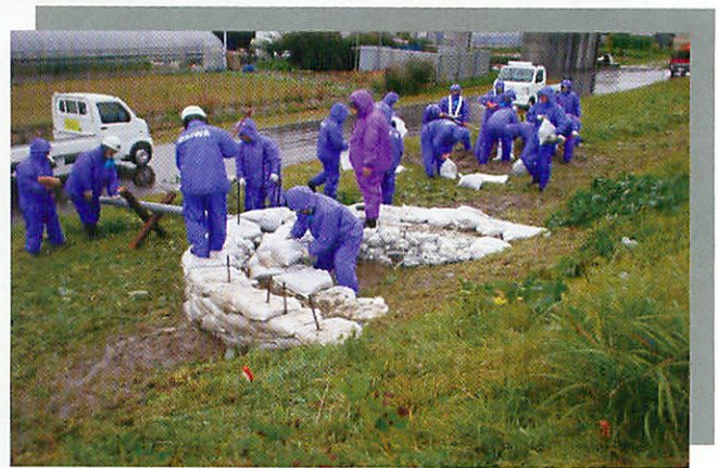
平成18年10月洪水 (鳴瀬川での水防活動)