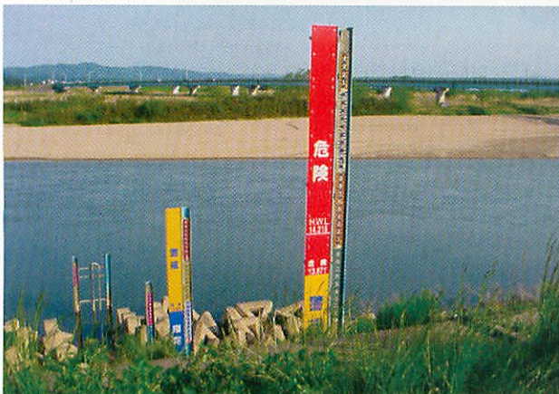
水位危険度レベル現地表示例