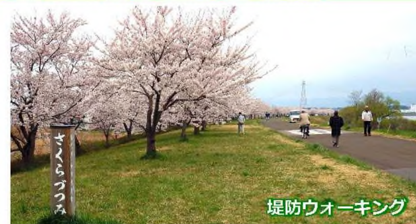
堤防ウォーキング