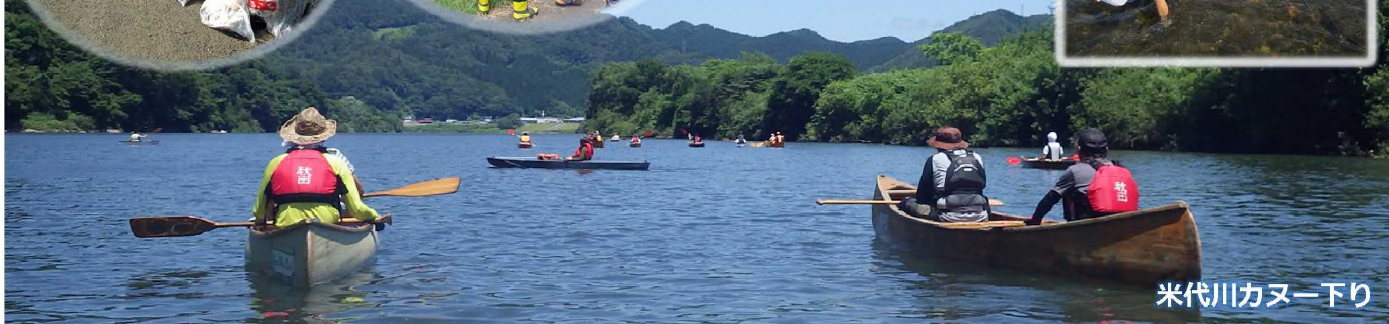
米代川カヌー下り