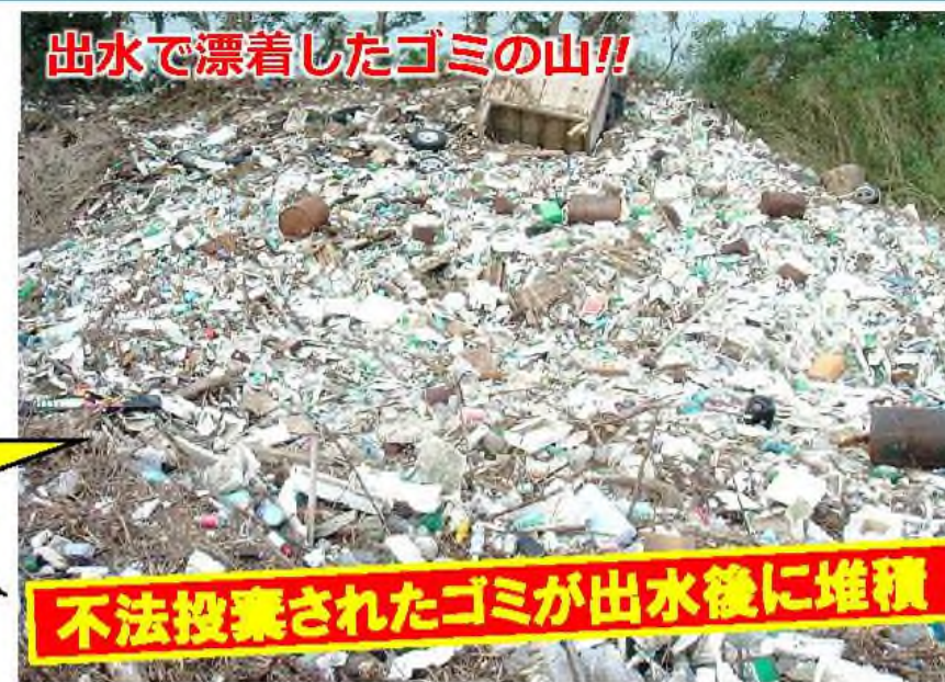
出水で漂着したゴミの山!!