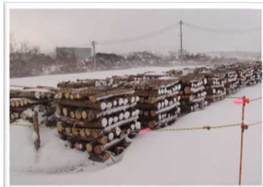
◀ 提供する樹木の様子