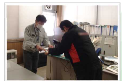
▲事務所長に代わり、出張所長より任命通知書を交付しました

米代川本川に流れ込む支川との合流部には、樋門や樋管という施設があり、洪水時に水位が上昇した際にゲートを開閉することで 宅地等への浸水被害を防ぐ役割 があります。この施設の操作等を行う 水門等水位観測員 を各施設の近隣住民の方に委嘱しております。