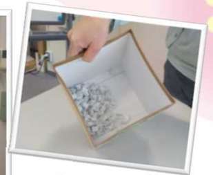
◀ 厳正な抽選を行い、当選者を決定