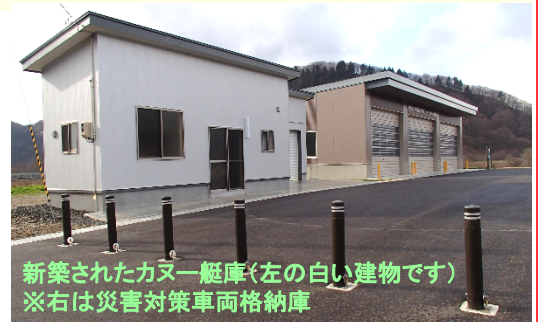
新築されたカヌー艇庫(左の白い建物です) ※右は災害対策車両格納庫

カヌースクールは1日4回、6～9月までほぼ毎日開催の予定です。これから本格的な冬期間となるため、来年度春以降、平常時の更なる賑わいの場として利活用していただければと思います。