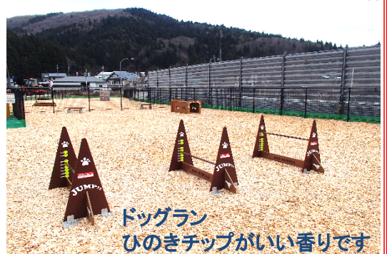
ドッグラン ひのきチップがいい香りです