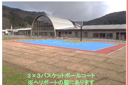
3×3バスケットボールコート ※ヘリポートの脇にあります