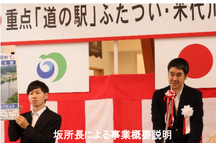
坂所長による事業概要説明