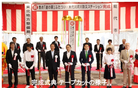
完成式典 テープカットの様子