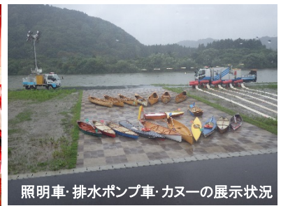
照明車・排水ポンプ車・カヌーの展示状況

平成30年7月7日(土)、能代市ニツ井町小繋地内に整備を行っていた『重点「道の駅」ふたついで』・『米代川ニツ井地区河川防災ステーション』の完成式が執り行われました。