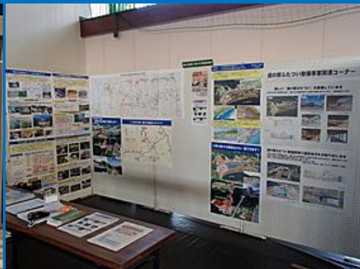
きみまちの里フェス