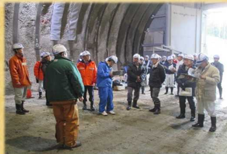
掘削途中のトンネル内の様子を見ていただきました。