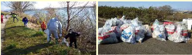
中川原堤防でのクリーンアップ