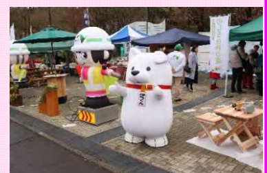
大館市観光キャラクター 「はちくん」がお出迎え