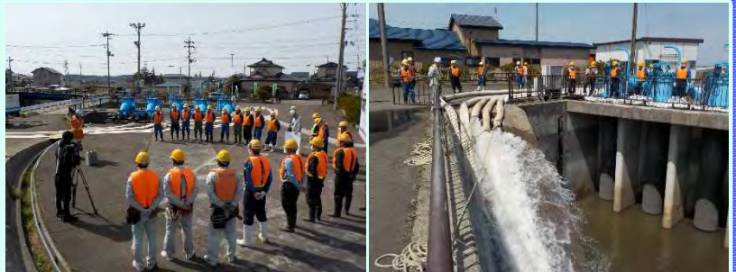
悪土川救急排水機場の稼働試験状況

能代河川国道事務所では、毎年、本格的な出水期を前に救急排水機場及び排水ポンプ車の稼働試験を実施しています。今年は4月17日（水）9時から約20人の作業員が稼働試験を行いました。洪水への備えを万全にし、地域の安全安心に貢献していきます。