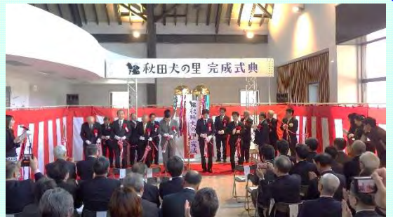
完成記念式典(テープカットとくす玉割り)