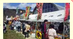
うまいもの大集合(28日)

4月27・28日に、米代川二ツ井地区河川防災ステーション多目的広場を会場にして「うまいも大集合in二ツ井」(主催：NPO法人二ツ井町観光協会)が開催されました。多目的広場を利用した初のイベントでしたが、道の駅「ふたつ」と一体的な利活用により賑わいが生まれています。【第959号 編集担当 工務第一課】