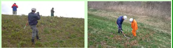
4月26日能代市鶴形地区の徒歩による堤防点検