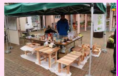
テーブルやベンチなど 秋田杉材木工品の展示販売

このイベントを通じて、木材が持つ香りや暖かさを実感していただき、太平山パーキングエリアそして秋田県北地域の魅力を届け、地域活性化に貢献していきます。