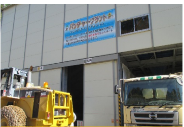
バッチャープラント

工事に先立ち、10月27日(火)に安全祈願祭が工事 関係者でしめやかに執り行われました。 工事に必要な設備も整い、これから掘削が始まります。