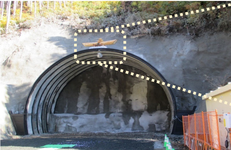
トンネル坑口(出入口)