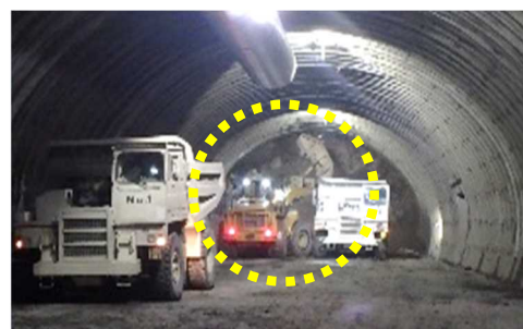
このように横方向に傾けることができます。

切り崩した岩をサイドダンプがかき出し重ダンプ車に積み込み、重ダンプ車がトンネル外の仮置き場へ運搬する、という流れになります。かき出し用のバケットは、横方向に傾けれるようになっており、これによりかき出した岩を効率よく重ダンプ車に積み込むことができます。サイドダンプのタイヤにはパンク防止、滑り止めのためチェーンが巻かれています。