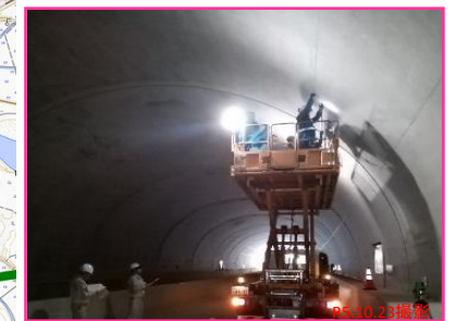
【今泉第二トンネル】 舗装工事完了 トンネル照明設備工事中