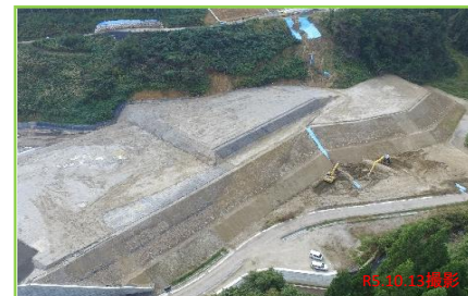
【今泉第二トンネル側 土工部】 押え盛土 2/3段目完了