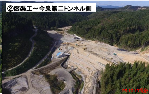
②函渠工～今泉第二トンネル側