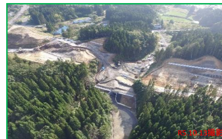
【No.520プレキャスト函渠部】 路体盛土工 施工中