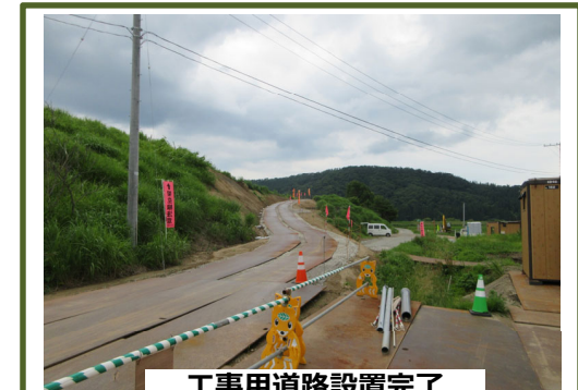
工事用道路設置完了