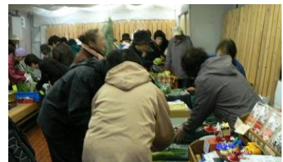
開店と同時に待ちかねたお客さんであっという間に満員御礼！