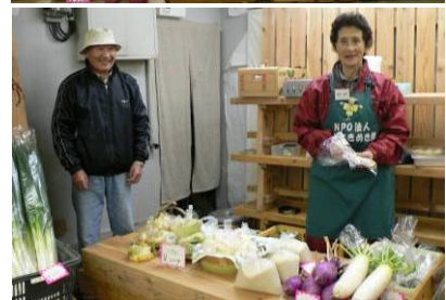
開店前。最後の朝市に向け冬野菜をたくさん用意しました。