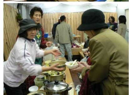
たくさん準備していた振る舞いのだまごも、みなさんに喜んでいただきました。