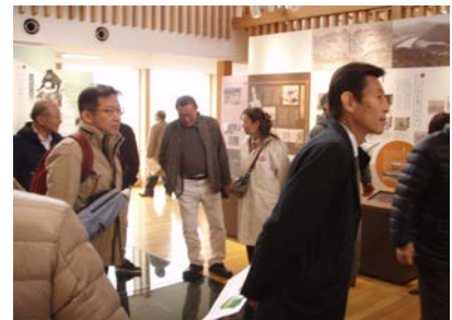
2 日目：道の駅「ふたつ」視察