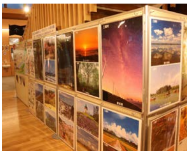
能代山本 4 市町村のビューポイントパネルを展示