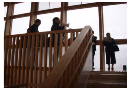
参加者へのしろ白神NWと道の駅が連携した取組を紹介