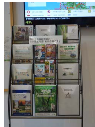
掲示ルールを決めて情報を整理したチラシラック