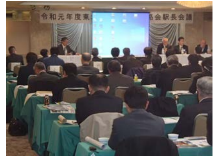
1 日目：東北「道の駅」駅長会議