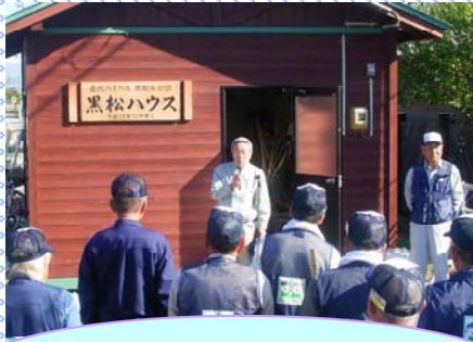
事務所長より激励のひとつ