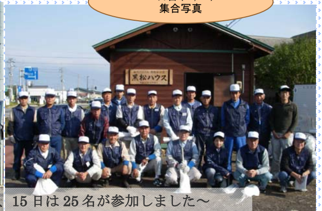
両日共に快晴で感激！！ ～14日は52名、15日は25名が参加しました～