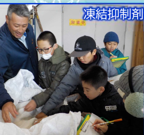
凍結抑制剤についての学習

出動式終了後は「冬の生活を支える除雪作業についての学習会」が行われ、凍結抑制剤等の学習や除雪機械の乗車体験を行いました。児童の皆さんは目を輝かせていました。