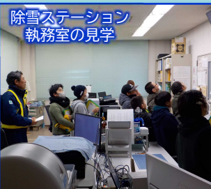
除雪ステーション 執務室の見学