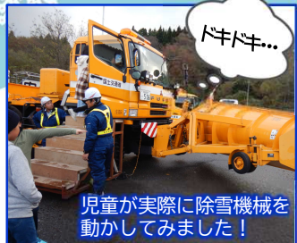
児童が実際に除雪機械を動かしてみました!