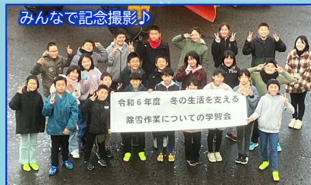
みんなで記念撮影♪