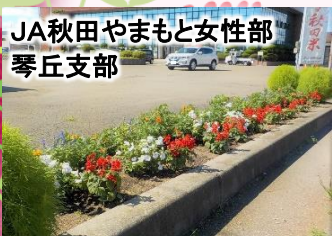
JA秋田やまもと女性部 琴丘支部