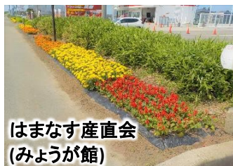
はまなす産直会 (みょうが館)