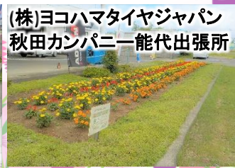
(株)ヨコハマタイヤジャパン 秋田カンパニー能代出張所