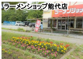
ラーメンショップ能代店