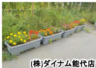
(株)ダイナム能代店