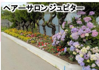
ヘアサロンジュピター