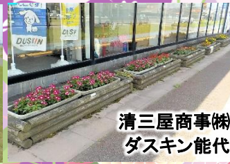
清三屋商事(株) ダスキン能代