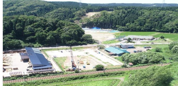
▲橋梁下部工施工中の様子(青森側より)

併せて国道7号へ信号制御によらずに合流することにより、交通の安全性向上及び円滑化が期待される事業です。