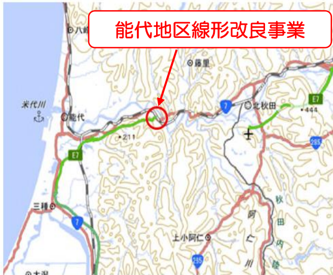
能代地区線形改良事業