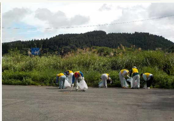
能代市ニツ井町種地内 国道7号 ニツ井西トンネル駐車帯