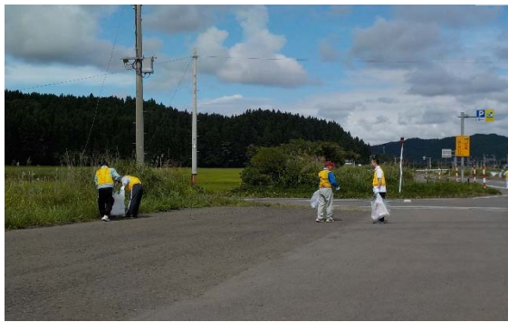
能代市ニツ井町切石地内 秋田道・ニツ井白神IC入口駐車帯