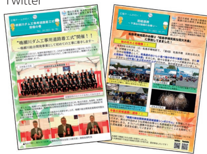
広報誌「広報チームが行く!」