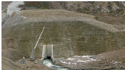
地すべり対策工事(胆沢ダム)