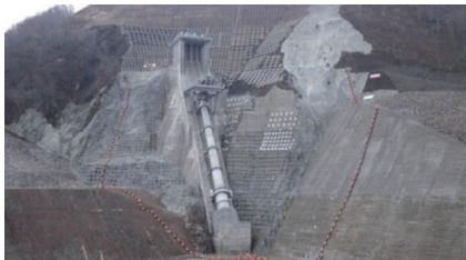
取水設備工事(胆沢ダム)