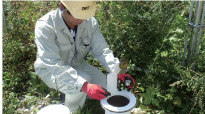
観測機器保守点検