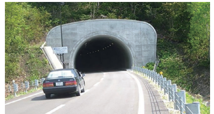
付替道路工事(成瀬ダム)