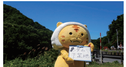
加美町公認キャラクターと連携した現場紹介