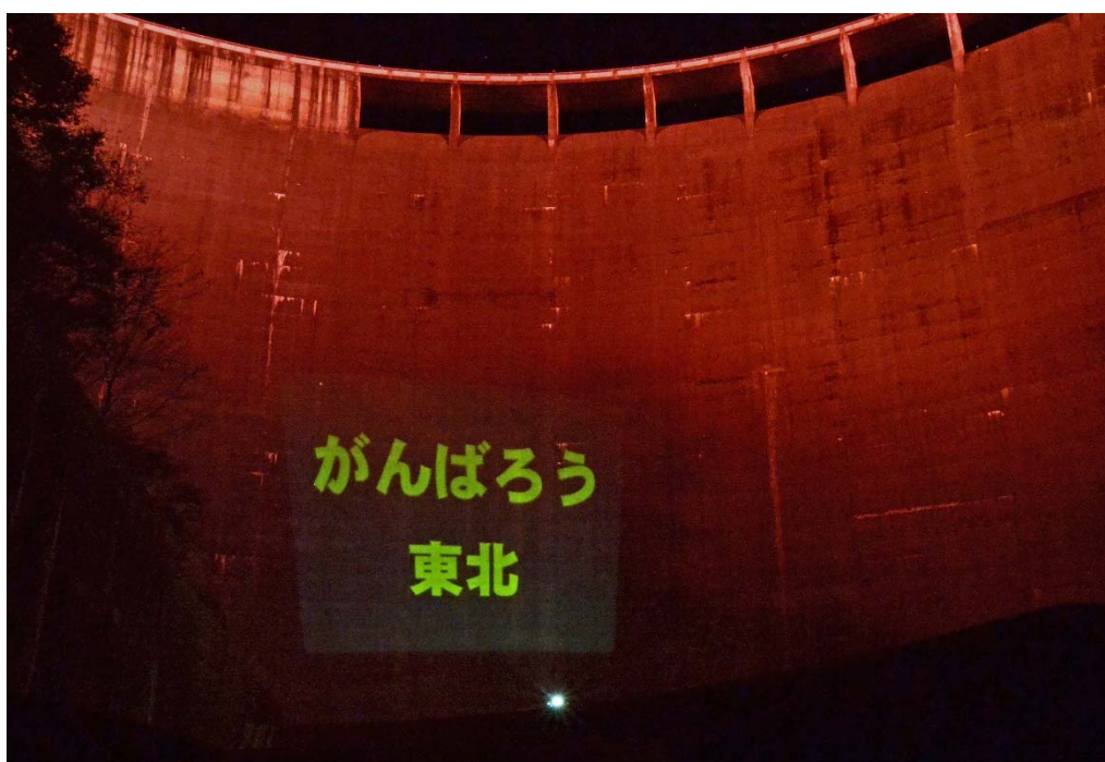
ダム堤体下流側から撮影