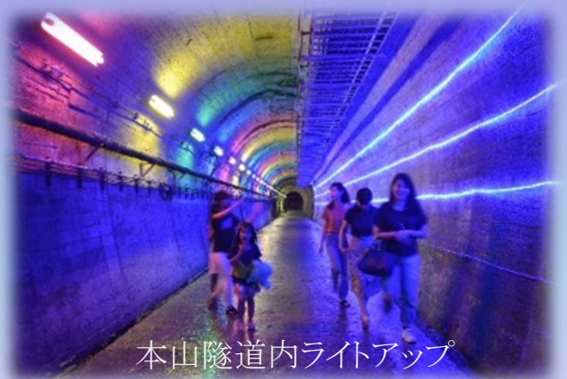
本山隧道内ライトアップ

点灯式 10月24日(木) 19:50 鳴子峡レストハウス前 ライトアップ 10月24日(木) 20:00~21:00 25日(金)~27日(日) 19:00~21:00