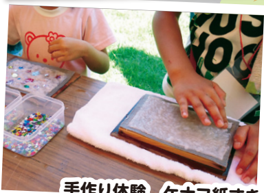
手作り体験 ケナフ紙すき