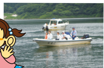
親子ダム探検ツアー