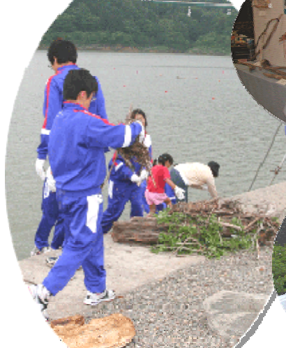
水源を守る町民大会

水源地域を守り、元気になる活動を紹介し、皆さんの身近な活動も、見方を変えるとビジョンの実現に深く関係しているんです。