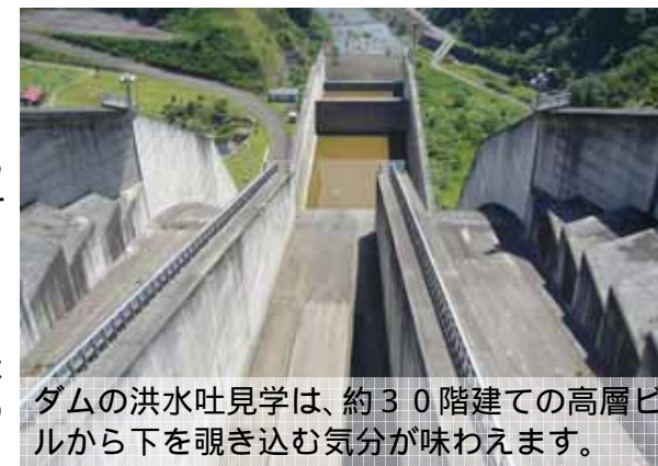
ダムの洪水吐見学は、約 30 階建ての高層ビルから下を覗き込む気分が味わえます。

ダムの放水ゲート(洪水吐)や地下通路(監査廊)など、普段入ることのできない場所も、事前に申し込めば見学することができます。申し込み方法は、最上川ダム統管理事務所のホームページ( http://www.thr.mlit.go.jp/mogami )まで！