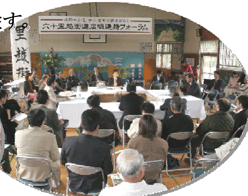
六十里越街道広域連携フォーラム