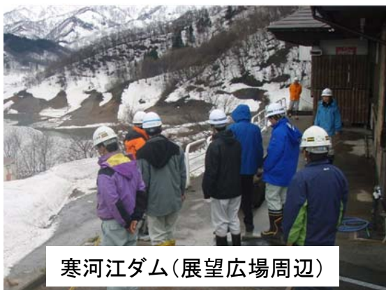
寒河江ダム(展望広場周辺)