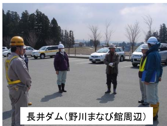
長井ダム(野川まなび館周辺)