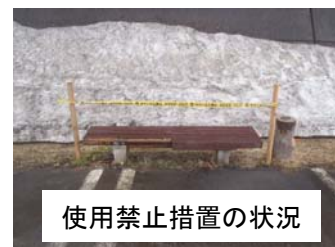
使用禁止措置の状況