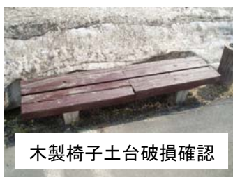
木製椅子土台破損確認