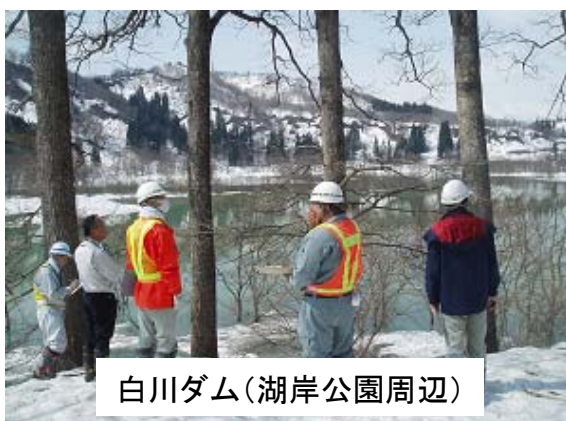
白川ダム(湖岸公園周辺)