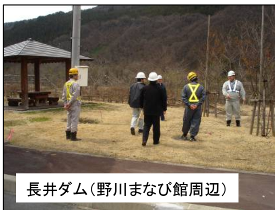
長井ダム(野川まなび館周辺)