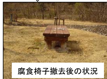
腐食椅子撤去後の状況