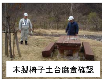
木製椅子土台腐食確認