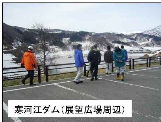
寒河江ダム(展望広場周辺)