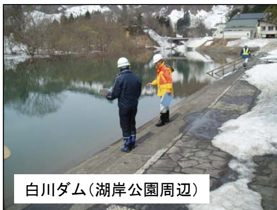
白川ダム(湖岸公園周辺)