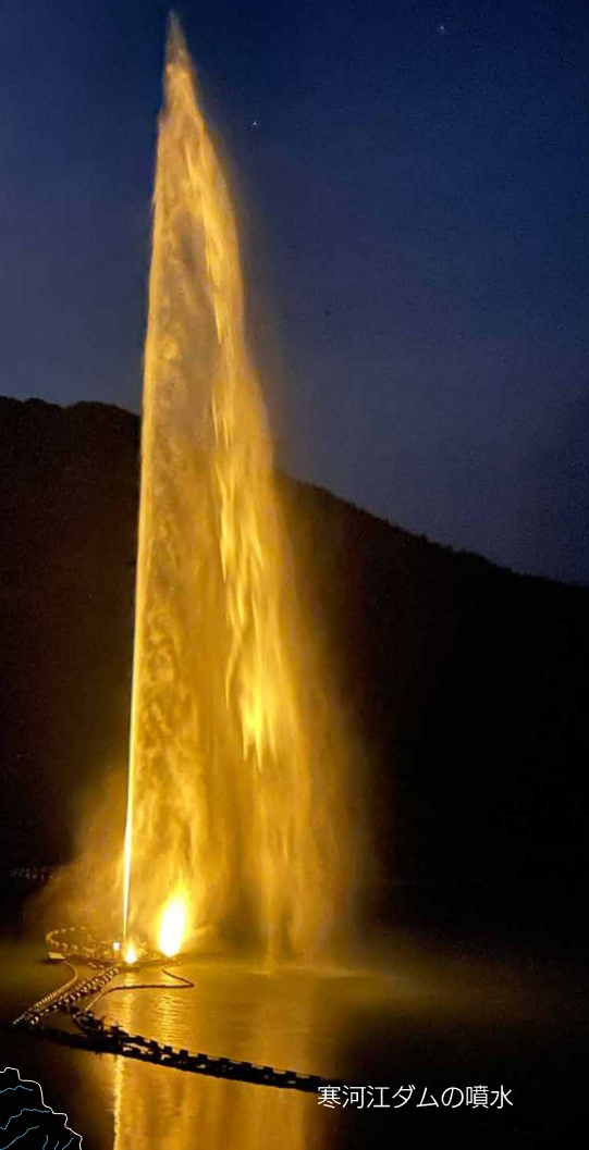
寒河江ダムの噴水