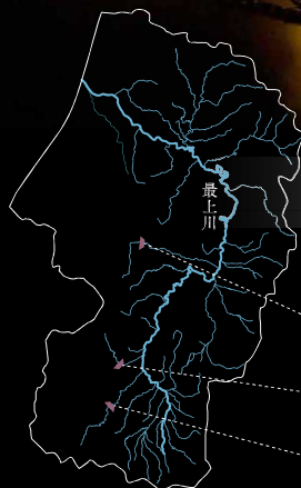
Mogamigawa Dam Map