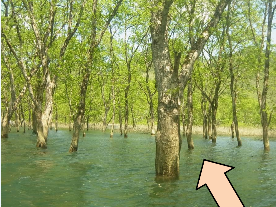
水没林の トンネルです♪