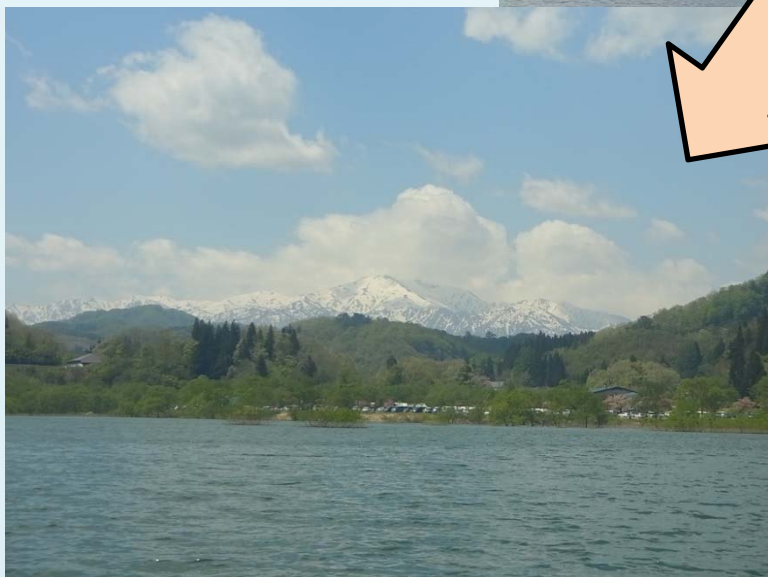
残雪映える飯豊山

(注) 写真はH28実施した時の状況です。当日の天候、貯水池の状況によりルート変更等があるため、必ず撮れる訳ではありません。