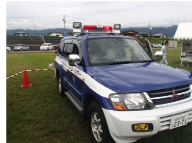
河川管理に使用する河川パトロールカー試乗