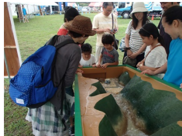
土石流の仕組みを学べる土石流模型実験