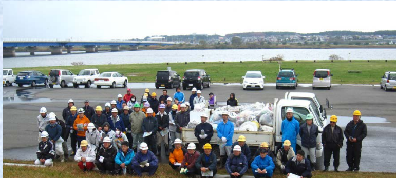
回収したゴミと一緒に

収集したゴミは、どこに、どんなゴミが、どれくらい落ちているかを種類ごとに分類調査し、何が原因となっているかを考え、ゴミの減量化、不法投棄をさせない等の社会づくりを目指す取組に役立てます。