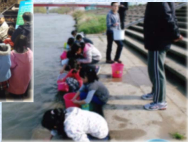
サクラマスの稚魚放流