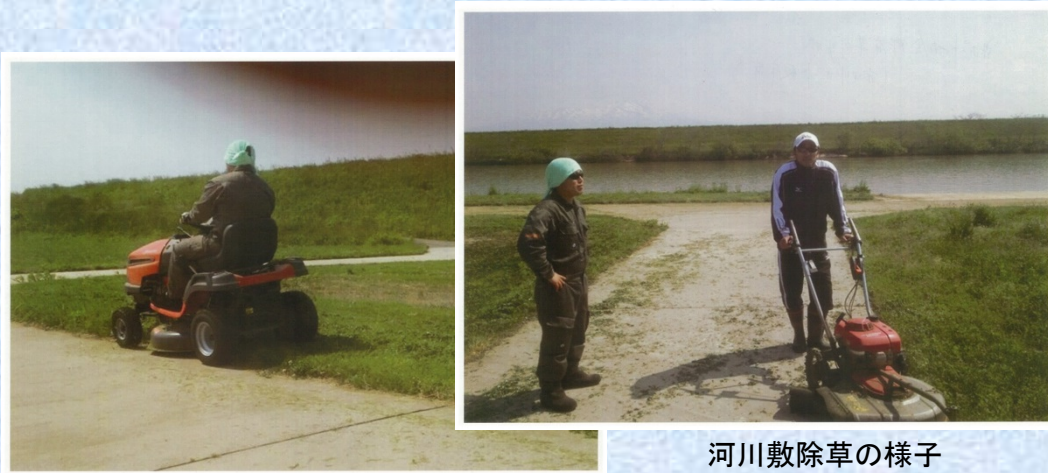
河川敷除草の様子

活動期間の4月から11月上旬までは、毎週末に河川敷の除草を行って、散歩などで利用される地域の方々にも気持ちよく使っていただけるよう心がけています。