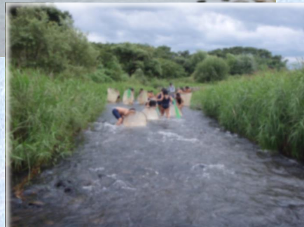
カジカ捕りの様子