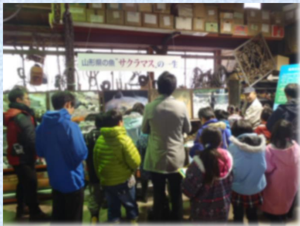
サクラマスの生涯についての語り

赤川に遡上するサクラマスの生涯についての語りや、サクラマスの稚魚放流、カジカ捕り体験など、地域の児童への自然体験学習を積極的に取り組んでいます。