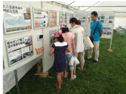
昭和42年羽越水害や長井ダムに関するパネルを展示したパネル展(小中学生向けに最上川について説明したパネルも展示)