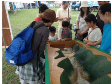
土石流の仕組みを学べる土石流模型実演