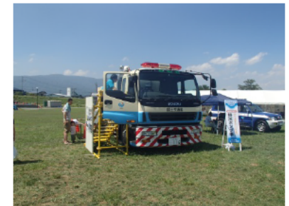
60m 3 /sの排水能力をもつ排水ポンプ車展示(搭乗可)