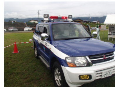
河川管理に使用する河川パトローラーの展示(搭乗可)