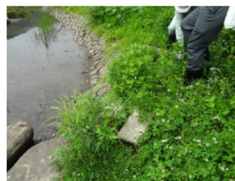
繁茂した草に隠れたコンクリートブロックを確認