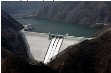
(試験湛水時の長井ダム)