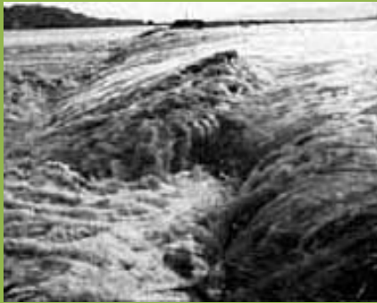
堤防を越える濁流（白鷹町鮎貝）

このため、28日早朝から降り出した山形県中南部の雨は、前線の動きにつれ、28日夕刻から29日未明にかけて激しさを増し、飯豊・朝日山系を中心とする西置賜地方では未曾有（みぞう）の集中豪雨となった。