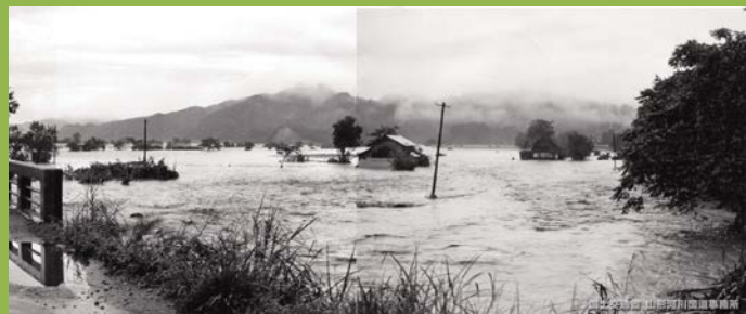
浸水被害（長井市歌丸）