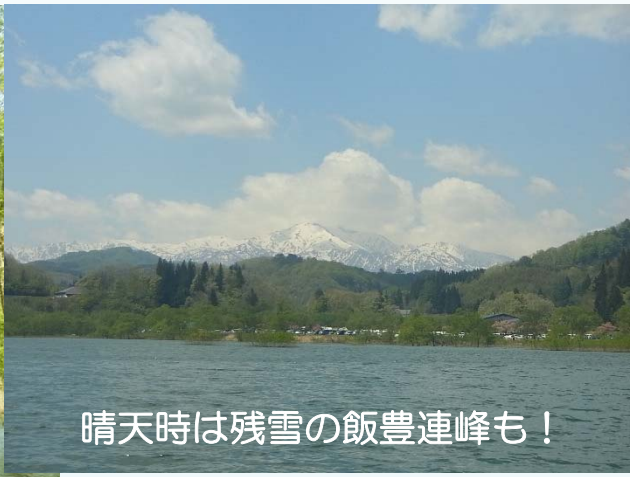
晴天時は残雪の飯豊連峰も！